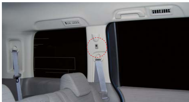
LUXDES (ラクデス) 取付け参考例