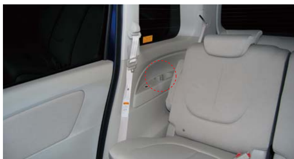
LUXDES (ラクデス) 取付け参考例