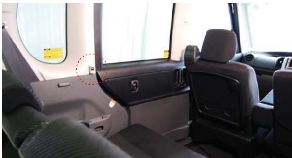
LUXDES (ラクデス) 取付け参考例