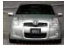
before / 装着前