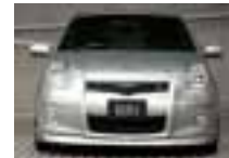
after / 装着後