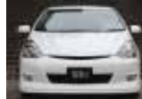
after / 装着後