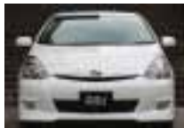
before / 装着前