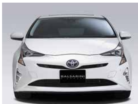
フロントスポイラー