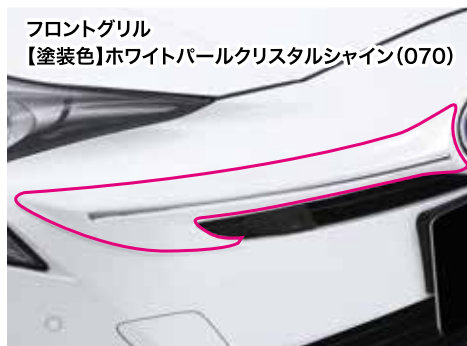
フロントグリル 【塗装色】ホワイトパールクリスタルシャイン(070)