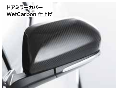
ドアミラーカバー WetCarbon 仕上げ