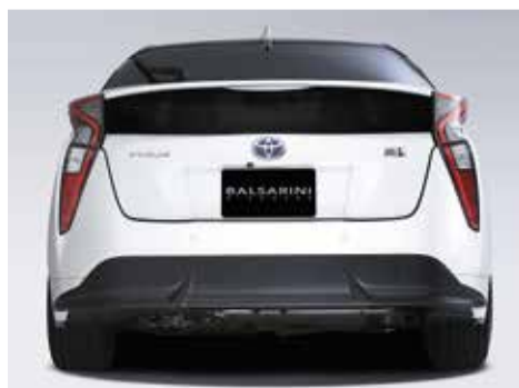
リアアンダースポイラー (FRP製)