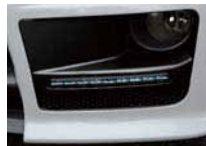
LEDデイルイト 非点灯