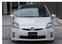
before / 装着前