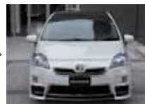
after / 装着後

設定色一覧表 ※塗装商品につきましてはあくまでも純正塗装品番の近似色となります。 ※塗装色につきましては撮影、印刷インキの関係で実際の色とは異なる場合がございます。