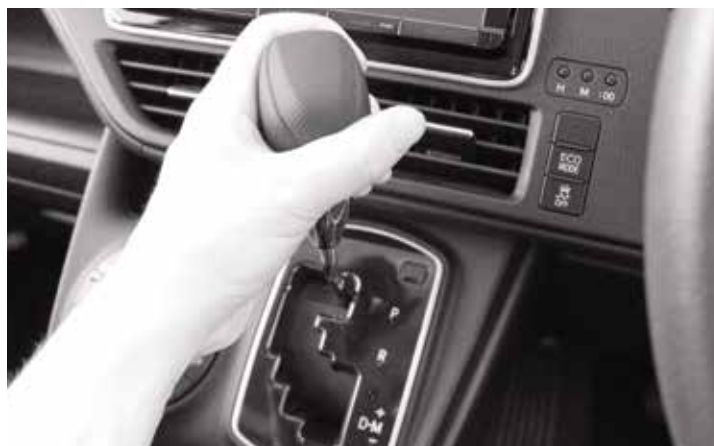
シフトノブを左に回し取外してください

【2】下図を参考に、シフトノブを取外した後、(1)本体を仮合わせを行ってください。